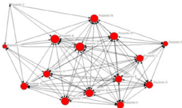
Gráfico 4. Red de categorías